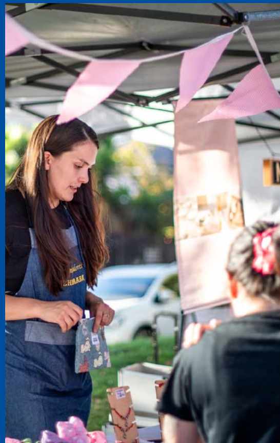
"Bazar Veraniego" en el Bandedjón Central de Pedro Fontova.

Con gran éxito se llevó a cabo, en el Bandedjón central de Pedro Fontova, el "Bazar Veraniego" , donde 50 emprendedores de la Incubadora de Emprendimientos e Innovación del departamento Laboral de la Municipalidad comercializaron sus productos y servicios entre 7 y el 14 de febrero.