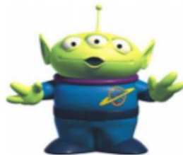
LEE CON VOZ DE EXTRATERRESTRE