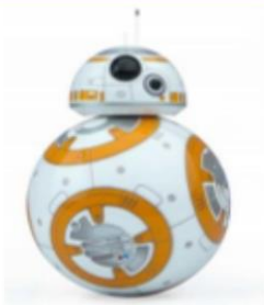
LEE CON VOZ DE ROBOT