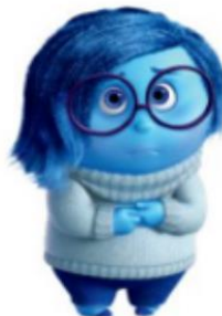
LEE CON VOZ DE TRISTEZA