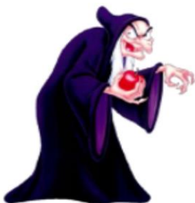
LEE CON VOZ DE BRUJA