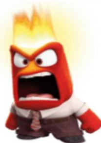
LEE CON VOZ DE ENOJO