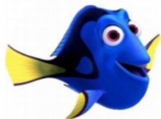
LEE CON VOZ DE DORY "BALLENA"